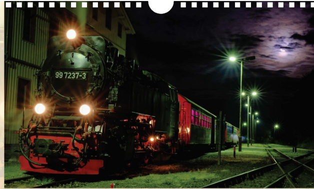
Ein Sonderzug wartet bei Mendach in Steig auf seine Gäste.