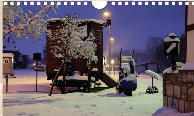
Winterstimmung auf dem Maschinengelände der Eisenbahnfreunde Selketalbahn in Geroda.