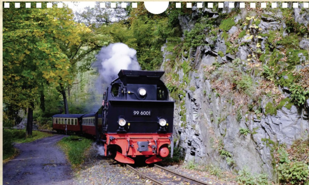
Zwischen Drahtseil und Stahlkammer auf der Fahrt nach Müggenberg.