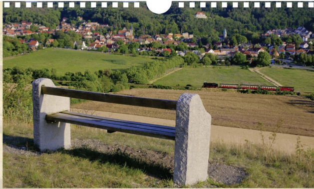
Vom Büchsenberg zeigt sich die Eisenbahn-Gemeinde. Die Kopfsteinmauer, Turm der St. Margareta, Am Garkhaus, Sanktberg, das ehemalige Fabrikgebäude für Silberbleicharbeiten und die Turm der ehemaligen St. Margareta-Kirche sind markante Bauten dieser Sonders.