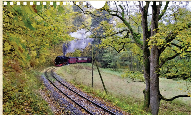
Im Spätherbst passiert Lok 99 7243 den Bergpass, auf dem sich die Burgwinde Heinrichsburg befindet.